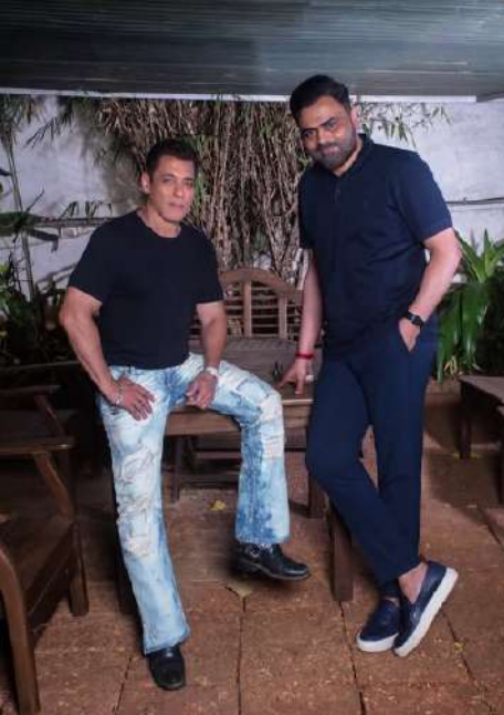
కొట్టిపారేతాయి. ఇక, సల్మాన్ ప్రస్తుతం దర్శకుడు పంకీ పైడిపల్లి, నిర్మాత దిల్ రాజు కాంటినేషన్ లో పనిచేస్తున్న షూటింగ్ లో బిజీగా ఉన్నారు.

'ది ఫ్యామిలీ ప్యూస్', 'షర్టీ' వంటి సూపర్ హిట్ సిరీస్ లకు దర్శకత్వం వహించిన రాజ్ నిడుమోరు ఇప్పుడు బాలీవుడ్ లో భారీ సినిమాకు సిద్ధమవుతున్నారు. తాజాగా జరిగిన ఓ ఇంటర్వ్యూలో రాజ్ ఆసక్తికర విషయాలు వెల్లడించారు. 'ఒక హాలీవుడ్ సినిమా స్క్రిప్ట్ ఇప్పుడే మొదలైంది, అది ప్రీ-ప్రాడక్షన్ దశలో ఉంది. మరో సిరీస్ కూడా అభివృద్ధి దశలో ఉంది. మా హిందీ సినిమా నిర్మాణం త్వరలో ప్రారంభం కానుందని తెలిపారు. ప్రపంచవ్యాప్తంగా ఉన్న ప్రేక్షకులను దృష్టిలోపెట్టుకొని, భారీ బడ్జెట్ తో ఈ సూపర్ సినిమా రూపొందిస్తున్నారు. అక్టోబర్ లో ఈ షూటింగ్ ప్రారంభించనున్నట్లు తెలుస్తోంది. ఈ సినిమాలో సల్మాన్ ఖాన్ హీరోగా నటిస్తారని సమాచారం. అయితే ఈ విషయంపై ఇంకా స్పష్టత రాలేదు. గతంలోనూ ఈ సినిమా గురించి వార్తలు ప్రచారమయ్యాయి. ఈ చిత్రంలో రాజ్ భార్య సమంత హీరోయిన్ గా నటించే అవకాశం ఉందని వార్తలు వచ్చాయి. అయితే, వాటిని రాజ్ సన్నిహిత వర్గాలు