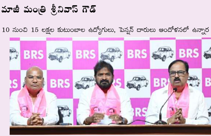
మాజీ మంత్రి శ్రీనివాస్ గౌడ్ 10 నుంచి 15 లక్షల కుటుంబాల ఉద్యోగులు, పెన్షన్ దారులు ఆందోళనలో ఉన్నారు