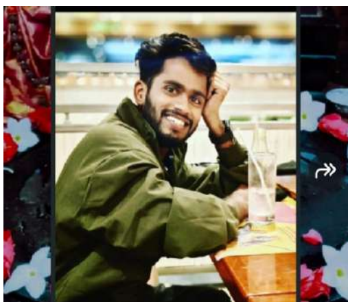
కారణమవుతోంది. ఘటనపై సమగ్ర విచారణ జరిపి వాస్తవాలను బయటపెట్టాలని, బాధిత కుటుంబానికి తగిన పరిహారం అందించి న్యాయం చేయాలని సీబీఐయా, కార్మిక సంఘాలు, స్థానిక ప్రజలు డిమాండ్ చేస్తున్నారు. సంబంధిత శాఖల అధికారులు స్పందించి పూర్తి వివరాలు వెల్లడించాల్సి ఉంది. ప్రస్తుతం మైత్రి డ్రగ్స్ పరిశ్రమలో జరిగిన ఈ ఘటన పారిశ్రామిక వర్గాల్లో చర్చనీయాంశంగా మారింది.