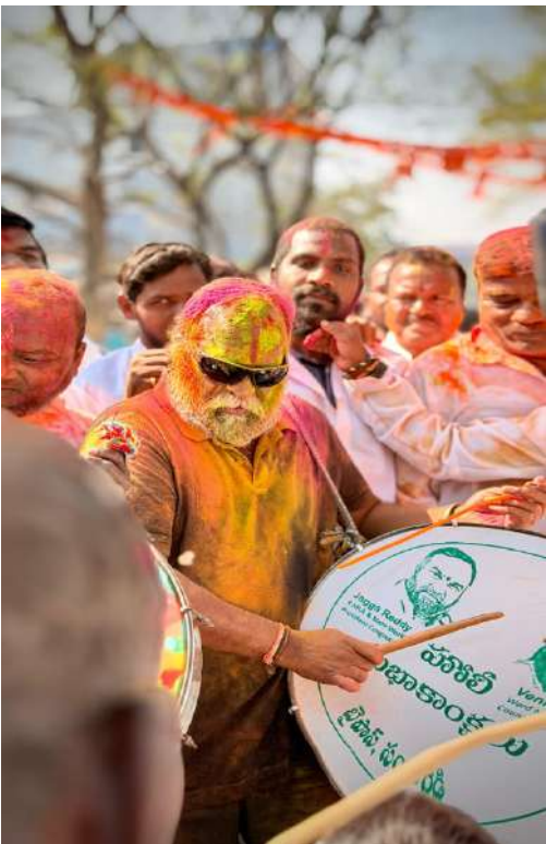
రంగుల పండుగ ప్రతి ఒక్కరి జీవితంలో ఆనందం, ఆరోగ్యం, ఐక్యతను, ఐక్యతను తీసుకురావాలని ఆకాంక్షించారు.