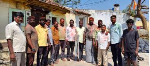
చేసుకోని సఖ్యతను చాటుకున్నారు. పిల్లలు, పెద్దలు ఒకరిపై ఒకరు రంగులు చల్లించాల్సి అవాంఛనీయ ఘటనలు లేకుండా హోలీ వేడుకలు ప్రశాంతంగా, ఉత్సాహభరితంగా కొనసాగాయి. హోలీ పండగను ఆనందంగా, ఐక్యతతో జరుపుకోవడం ద్వారా గ్రామ ప్రజలు సాంఘిక

చేగుంట మండలం అసంతసాగర్ గ్రామం లో బుద్ధవారం నిర్వహించిన హోలీ నిరహించి సర్పంచ్ లు, ఉపసర్పంచ్ లు, పాల్గొని గ్రామ ప్రజలకు హోలీ శుభాకాంక్షలు తెలిపారు. ఈ కార్యక్రమంలో గ్రామం లో ఉన్న వివిధ పార్టీల నాయకులు, కార్యకర్తలు, యువత పాల్గొన్నారు. గ్రామం లో ఉదయం నుంచే యువత, చిన్నారులు గుంపులుగా చేరి రంగులతో సందడిచేసుకుంటూ హోలీ శుభాకాంక్షలు తెలుపుతున్నారు. కొందరు నృత్యాలు చేస్తూ ఆనందం పంచుకున్నారు. వీధులన్నీ రంగుల మయం కావడంతో పండగ వాతావరణం నెలకొంది. స్థానికులు పరస్పరం అలెబలై