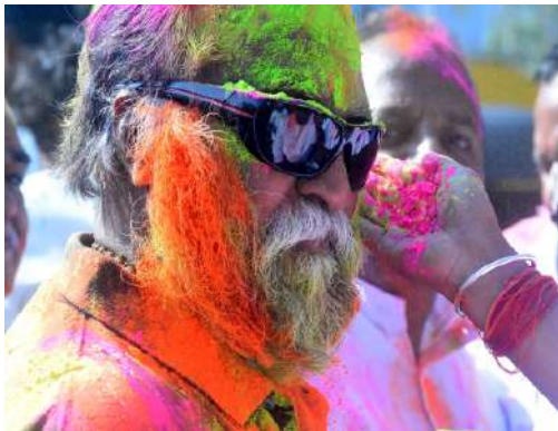
కోరుకుంటున్నాను" అని తెలిపారు.